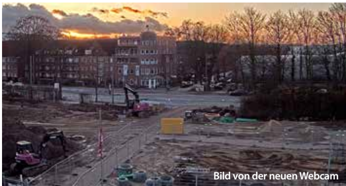
Bild von der neuen Webcam

Der ETV wird im Januar und Februar das Mitgliederportal zusammen mit den Abteilungen und den hauptamtlich geführten Bereichen wie der FitGym oder dem Kindersport vorbereiten und auch die Mitglieder mit einem Vereinsmailing Ende Januar über die neue, digitale Lösung informieren. Ab Ende März wird das Portal dann für die Mitglieder und Mitarbeiter freigeschaltet.