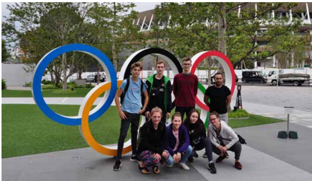
Reise zu den Ringen: Eimsbüttels Delegation vor dem Olympiastadion in Tokio

Im Hinblick auf die Olympischen und Paralympischen Spiele in Tokio hat die Japan Sport Association die Host Town Initiative ins Leben gerufen. Diese bietet jedem teilnehmenden Land eine japanische Partnerstadt, welche ihm Trainings- und Akklimatisierungsmöglichkeiten im Vorfeld der Spiele bietet. Zudem hofft die japanische Regierung, dass die Anziehungskraft des Sportgroßereignisses auch in die kleineren Städte und Gemeinden des Landes strahlen und so nicht nur Tokio von dem Mega-Event profitiert wird.