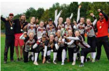
11 WUNDER IN WESSELING Die Softballerinnen holen den Deutschland-Pokal