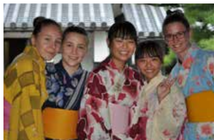
25 TEE IN TOYOHASHI ETV-Delegation besucht Japans Olympia-Partnerstadt