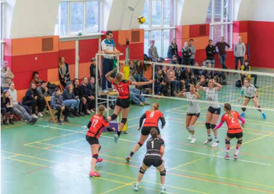
06 ELAN IN EIMSBÜTTEL Unsere Volleyballer schmettern sich nach vorn